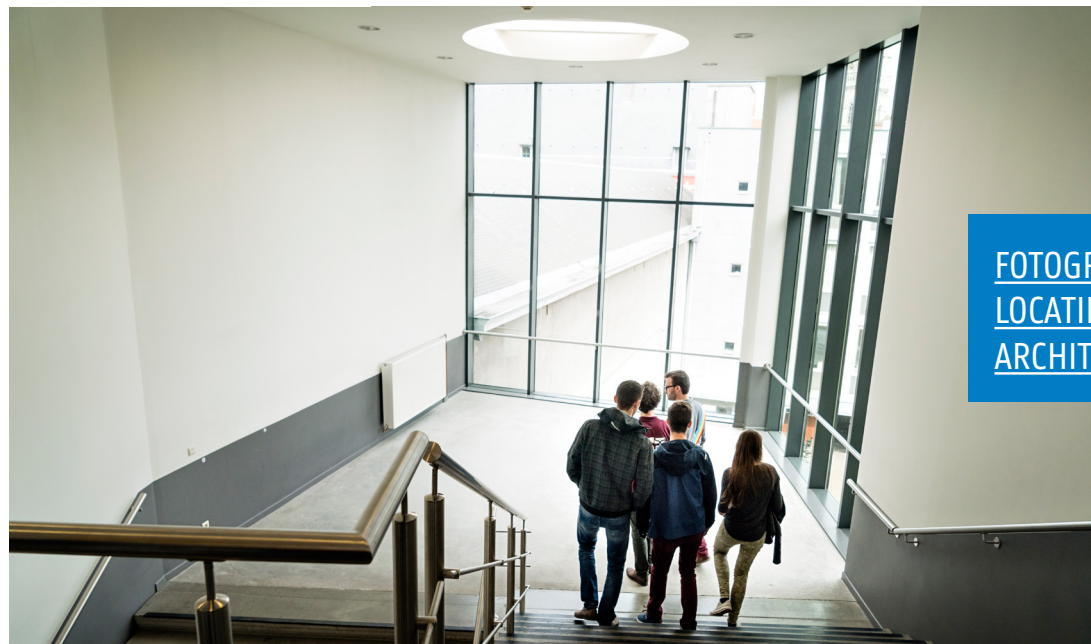
FOTOGRAFIESTIJL 4: LOCATIES OF ARCHITECTUUR