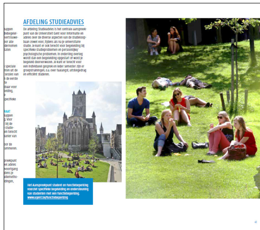
voorbeelden van plaatsing losse foto