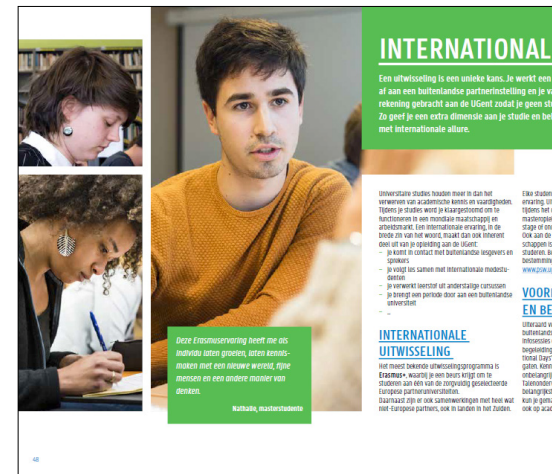
voorbeelden van plaatsing collage met meerdere foto's (fotowolk)