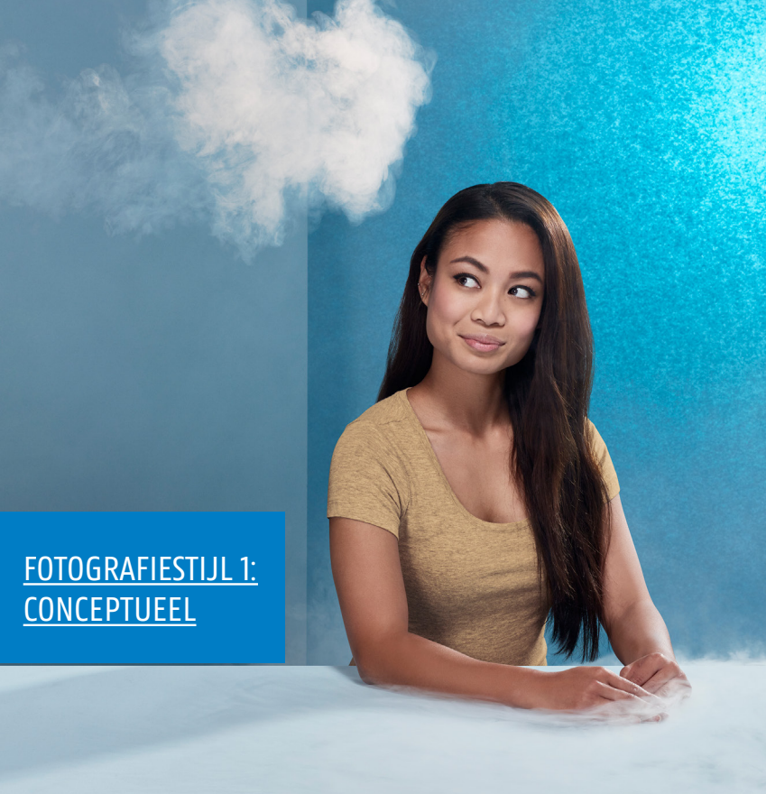
FOTOGRAFIESTIJL 1: CONCEPTUEEL